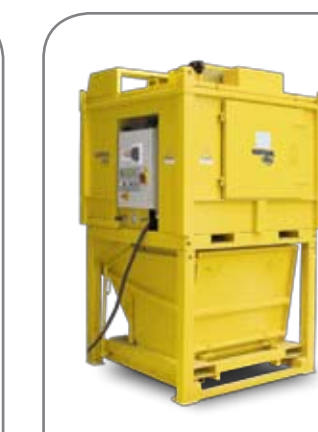
Compact s kontajnerom