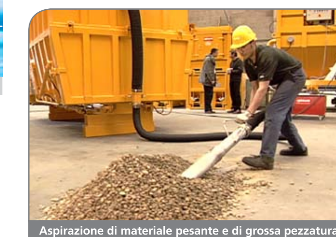
Aspirazione di materiale pesante e di grossa pezzatura