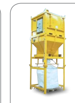
Compact s násypkou priamo do Big Bagu

Vysokovýkonné priemyselné vysávače sú nenahraditeľné v ťažkom priemysle na odsávanie prašných alebo zrnitých materiálov vyprodukovaných počas výrobného procesu.