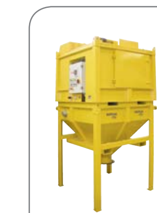
Compact s násypkou