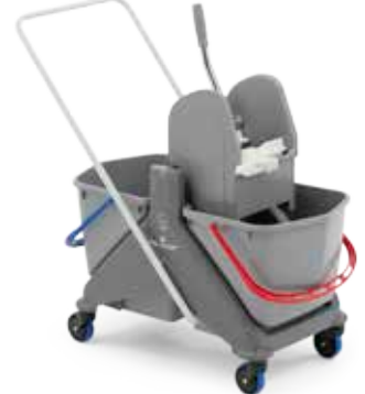
Carrello in plastica 50 lt con impugnatura verniciata Plastic trolley 50 L with Rilsan coated push-bar