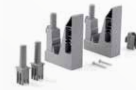
Per aggancio su carrelli Morgan Attachment kit for Morgan trolleys