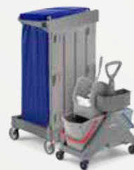
Art. MA0001000U000 55x55x102 cm