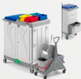
Art. MA080114U000 98x58x114 cm