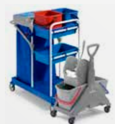
Art. 0000MP2150A 96x61x113 cm