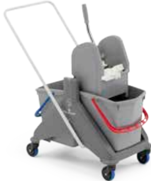
Carrello in plastica 30 lt con impugnatura verniciata Plastic trolley 30 L with Rilsan coated push-bar