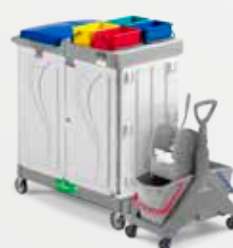
Art. MA0801014U000 98x58x114 cm