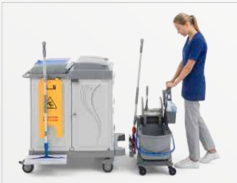
Avvicinarsi al carrello Get close to the trolley