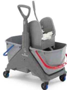
Carrello in plastica 50 lt con maniglia plastica Plastic trolley 50 L with plastic grip