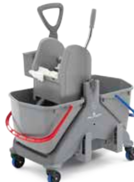
Carrello in plastica 50 lt con maniglia plastica, cassetta e reggiscopa Plastic trolley 50 L with plastic handle, caddy and mop holder