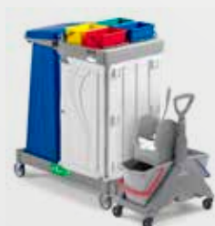
Art. MA0601000U000 92x58x114 cm