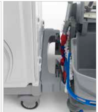
Agganciare al carrello Hook OneFred to the trolley