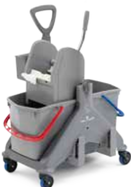
Carrello in plastica 30 lt con maniglia plastica, cassetta e reggiscopa Plastic trolley 30 L with plastic handle, caddy and mop holder