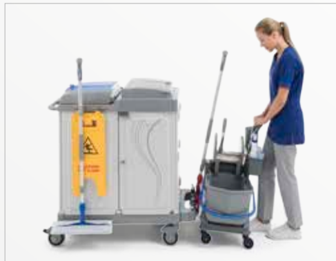
Inclinare e posizionarsi sull'aggancio Tilt and place on the attachment kit