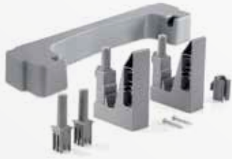
Per aggancio su carrelli Alpha Attachment kit for Alpha trolleys