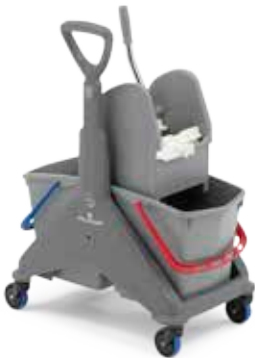
Carrello in plastica 30 lt con maniglia plastica Plastic trolley 30 L with plastic grip