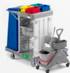
Art. MA0201000U000 97x58x114 cm